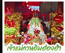
เจ้าแม่กวนอิมฮ่องกงอ่า