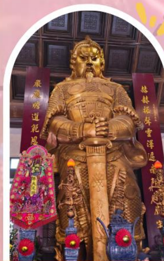
วัดเซกวง ขอพรโชคลาภ การเงิน และธุรกิจ