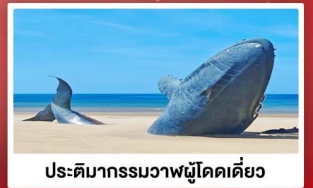
ประติมากรรมวาฬผู้โดดเดี่ยว