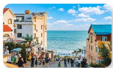
ถนนคอบเพลิงหมายเลขแปด