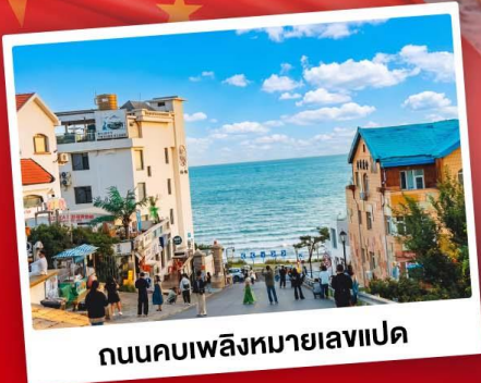
ถนนคอปเปลิงหมายเลขแปด