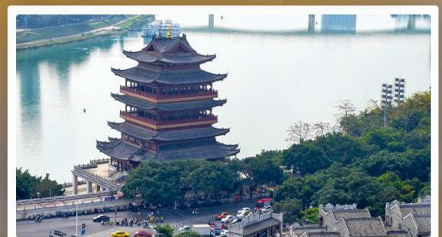
ถนนสามสายสองตอรอก