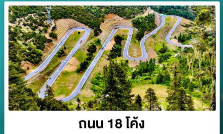
ถนน 18 โค้ง