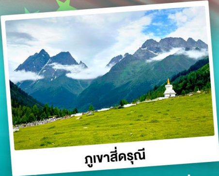
ภูเขาสิ่ดรุณี