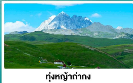
ทุ่งหญ้าย่าง