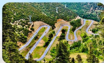
ถนน 18 โค้ง