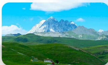
ทุ่งหญ้าด่าง