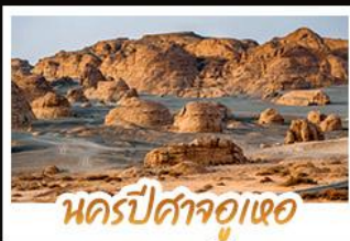
นครปีศาจอู๋เออ

หนาวนี้ที่ซินเจียง เราเลือกความงามสุดอลังการของอุทยานคานาสีอู๋ เก็บภาพสวยครบทุกพีค ทั้งศาลาขมปลา อ่าวเสี่ยวจินตรา อ่าวซอมนังกร และอ่าวเทพทวด • นอนพักค้างคืนในกระท่อมไม้ ภายในหมู่บ้านเหม่บู๋ ตีบเข้ามาสู่อากาศบริสุทธิ์และทัศนียภาพหมู่บ้านที่ถูกหิมะปกคลุมราวกับเมืองในฝัน นังกรไฟชมวิวนครปีศาจอู๋ • ซุปป์ิงของฝากทีละตาแกรนด์บาซาร์ เมืองอู๋มู่ตี้