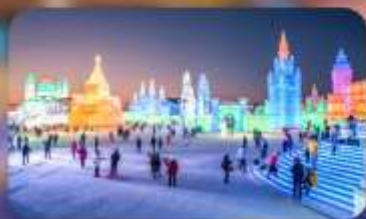
เทศกาลน้ำแข็งฮาร์บิน