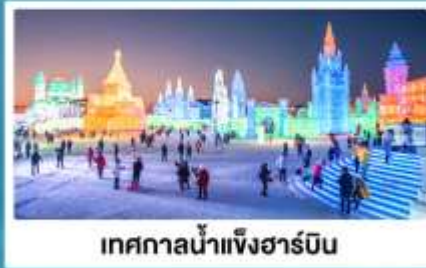
เทศกาลน้ำแข็งฮาร์บิน