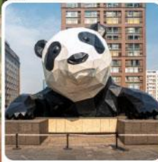
หมีแพนด้ายักษ์ป็นตึก