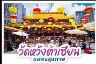
วัดเซว้งต้าเซียน บอพรสุภภาพ