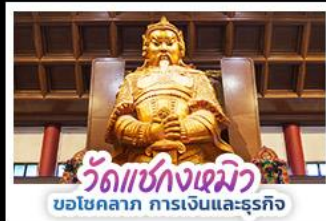
วัดเซ่งกวงเมียว ขอโชคลาภ การเงินและธุรกิจ