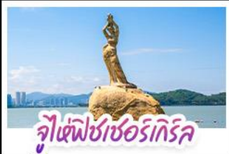
จูเซีฟิซเซอร์เทิร์ล