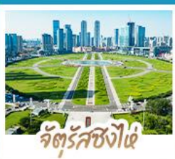
จัตุรัสชิงไผ่