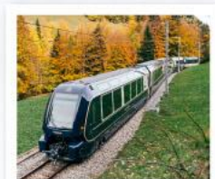
รถไฟโกลเดนพาส