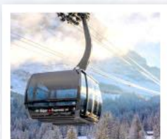
ขึ้นกระเช้ายอดเขาจุงเฟรา