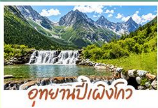
อุทยานปี่ผิงโกว