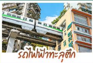
รถไฟฟ้าทะเลสาบสี่จ้อป้า

ชมธรรมชาติ ณ อู่หลง ชมหุบเขาสุดอลังการระดับมรดกโลก นั่งรถไฟฟ้าทะเลสาบสี่จ้อป้า สัญลักษณ์เมืองฉงชิ่งสุดล้ำ สัมผัสวิถีภูเขาหิมะแห่ง ภูเขาสี่ดรุณี งดงามจนได้รับฉายา “เทือกเขาแอลป์แห่งตะวันออก” ชมธรรมชาติสุดฟิน ณ อุทยานปี่ผิงโกว • ซ้อปิ่งจู่ใจ ถนนคนเดินไท่กู่หลี่, ถนนคนเดินซุนซู่