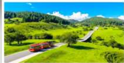
เหนางฟ้า

เดินทางโดย: สายการบินฉงฉิ่งเจียงเป่ย์ (PN)