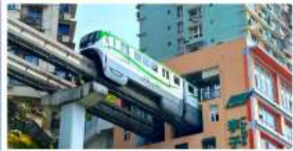
รถไฟฟ้าลัดดี