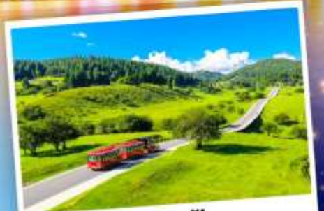
เจานางฟ้า