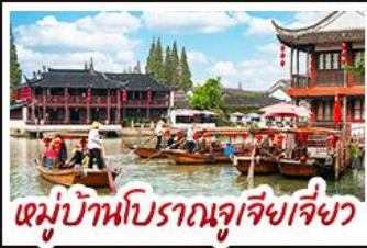
หมู่บ้านโบราณจูเจียงเจี๋ย