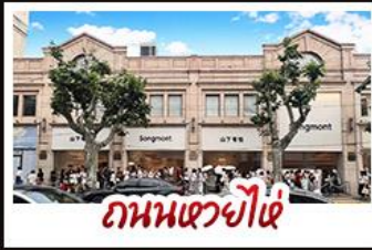
ถนนเซี่ยงไฮ้