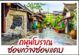
ถ้ำหินโบราณ เซียงกวางชอยแควบ