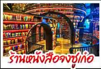
ร้านหนังสือจงซูเก้อ