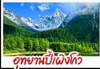
อุทยานป่าผิงโกว

อุทยานสัตว์รุ่นนี้ - อุทยานป่าผิงโกว - เมืองตู่เจียงเจียงน - รูปปั้นเมฆิแพนถ้ำอนเชลฟี ร้านหนังสือจงซูเก้อ - ล่องเรือชมแหล่งฟอโตเล่อซาน - ถ้ำหินโบราณเซียงกวางชอยแควบ - วัดต้าซือ ถ้ำหนคณดินซุ่นซี - ธีมแพนถ้ำปิ่นฮิก IFS - ถ้ำหนิทู่เซี - ชมแสงสีน้ำพุไมไฟฮิก Sky - ชมฮิกแพดเจิงตู