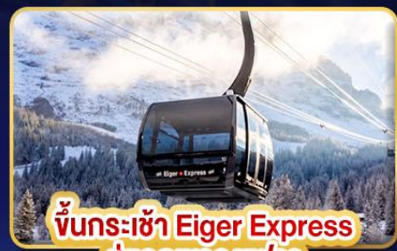
ขึ้นกระเช้า Eiger Express สู่ยอดเขาจุงเฟรา