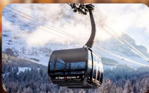
ขึ้นกระเช้า Eiger Express สู่ยอดเขาจุงเฟรา