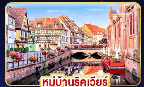
หมู่บ้านริคเวียร์