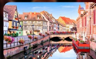
หมู่บ้านริควีเยร์