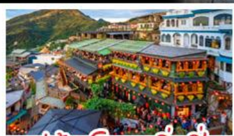
หมู่บ้านโบราณจิ่วเฟิ่น