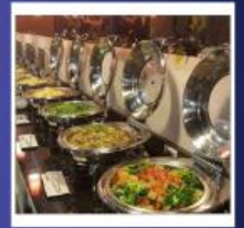
RENYI LAKE HOTEL

หมายเหตุ: **ปัจจุบันโรงแรมได้หวั่นมีนโยบายเพื่อลดโลกร้อน ตั้งแต่ปี 2568 เป็นต้นไป** โรงแรมที่พักงดบริการแจก สบู่ แชมพู ครีมนวด และผลิตภัณฑ์ดูแลผิวส่วนรวม *สิ่งที่ต้องเตรียมของใช้ส่วนตัวไปเอง! ครีมนวด แชมพู ครีมนวด โลชั่น หมวกอาบน้ำ หวี แปรงสีฟัน ยาสีฟัน และของใช้ส่วนตัวอื่นๆ เพื่อสุขอนามัยที่ดีและเป็นมิตรกับโลกลดโลกร้อนรักษ์โลก...พกของใช้ส่วนตัว สบายใจ ไร้กังวล