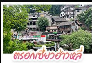
ตรอกเซียวฮ่าวเฉี