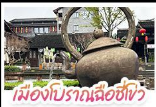
เมืองโบราณฉือชิว