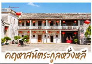
อุทยานวัฒนธรรมกุหลาบหงส์

ตามรอยภาพยนตร์สุดซึ้งแห่งปี "จดหมายรักถึงอาม่า" • เยี่ยมเมืองโบราณเต๋จิว ดินแดนต้นกำเนิดชาวจีนโพ้นทะเลที่อพยพสู่ประเทศไทย • เดินเล่นหมู่บ้านโบราณหลงหู สัมผัสบรรยากาศเต๋จิวดั้งเดิมราวกับหลุดเข้าไปในฉากหนึ่ง • ชมย่านเมืองเก่าชิวเถาและ สวนสาธารณะสีเขียวชอุ่ม หนึ่งในสถานที่ที่ได้รับความนิยมจากแฟนภาพยนตร์ ชมจดหมายโบราณอายุกว่าร้อยปี ณ พิพิธภัณฑ์จดหมายชาวจีนโพ้นทะเล