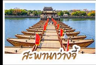
สะพานกว้างจี