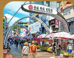
ตลาดนัมโพดง