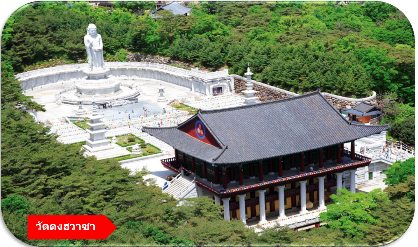
วัดดงฮวาซา