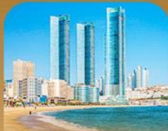
หาดแฮอินแด