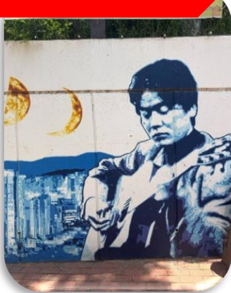
ถนนคิมควังชอก

นำท่านเที่ยวชม ถนนคิมควังชอก เป็นถนนสายเล็ก ๆ สุดอบอุ่นในเมืองแทกู ที่สร้างขึ้นเพื่อระลึกถึง คิมควังชอก นักร้องโฟล์กในตำนานของเกาหลีใต้ ผู้เกิดที่แทกูและเป็นศิลปินที่คนเกาหลียังคงรักมากจนถึงทุกวันนี้ เดิมทีบริเวณนี้เป็นกำแพงเก่าใต้ทางรถไฟ แต่ภายหลังถูกพัฒนาให้กลายเป็น "ถนนแห่งเสียงเพลงและความทรงจำ" ตลอดทางจะเต็มไปด้วยภาพวาดกราฟฟิตี้ รูปปั้นของคิมควังชอก งานศิลปะและมุมถ่ายรูปแนววินเทจ เส้นห์ของถนนนี้ไม่ใช่ความอลังการ แต่เป็นความรู้สึก "อบอุ่นและมีเรื่องราว" คาเฟ่ ร้านดนตรี และบรรยากาศย้อนยุค