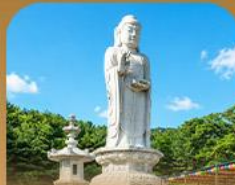
วัดดงฮาซา

เปิดประสบการณ์เที่ยวเกาหลีสุดคุ้ม 5 วัน 3 คืน เที่ยวสองเมือง • เช็กอินถนนนักร้องคิมควังซอก สัมผัสเสน่ห์ศิลปะและเสียงเพลง • นั่งรถไฟปิ๊งวิวทะเลปูซาน • หมู่บ้านคิมซอนสีล้นสดใส ก่อนเยือนวัดแฮดงยงกุงซาและวัดคยองฮวาซา เสริมความเป็นสิริมงคล • แวะชมท่าเรือสีรุ้ง Bunezia ปิดท้ายด้วยช้อปปิ้งเอาท์เล็ตแดนคัมมาร์เก็ตช็อดัง พร้อมเดินช้อปปิ้ง Walking Street สุดฟิน