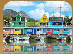
ท่าเรือจ้งนึม