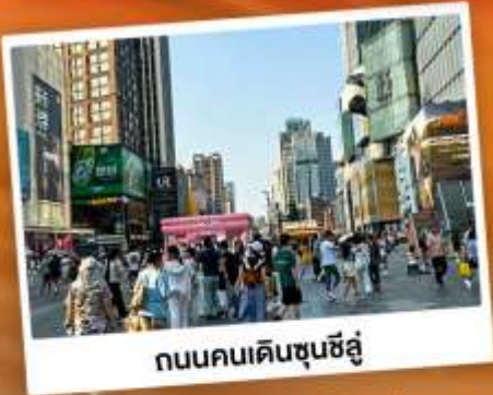
ถนนคนเดินชุนชี่อู่