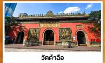
วัดต้าเจี๋ย