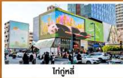
ไท่กูหลี่