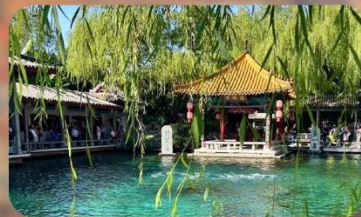
พิพิธภัณฑ์เบียร์ซิงเต่า