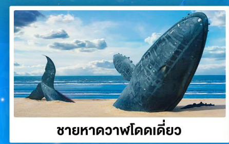
ชายหาดวาฬโดดเดี้ยว