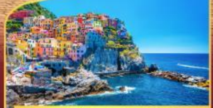
หมู่บ้านมานาโรล่า