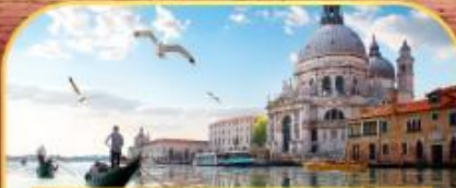
นั่งเรือสู่เกาะเวนิส