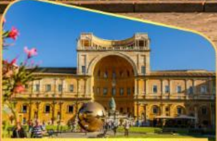
เข้าชมพิพิธภัณฑ์วาติกัน