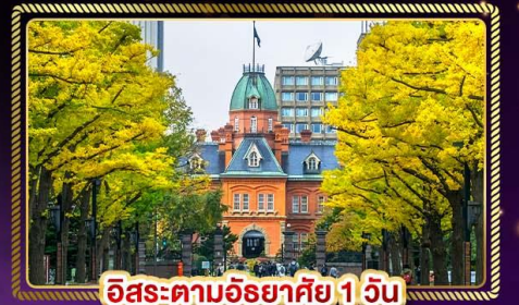
อิสระตามอัธยาศัย 1 วัน

น้ำหนักกระเป๋า 20 Kg. บริกตราอาหาร บนเครื่อง ไป-กลับ