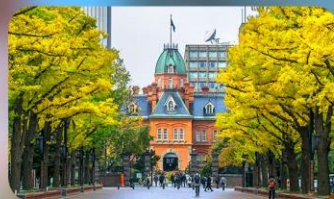
อิสระตามอัธยาศัย 1 วัน