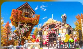
โรงงานช็อกโกแลต ชิโรอิ โคอิบิโตะ

SAPPORO TOKYU REI หรือเทียบเท่ามาตรฐานญี่ปุ่น