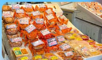
ตลาดปลาโจโก