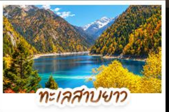
ทะเลสาบขาว