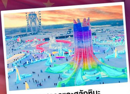
เทศกาลแกะสลักหิมะ