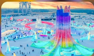
เทศกาลแกะสลักหิมะ