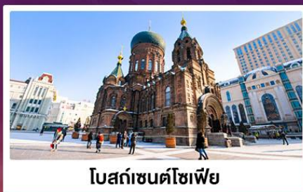
โบสถ์ซันตโซเฟีย