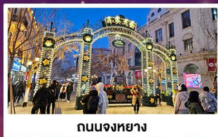
ถนนจงหยาง