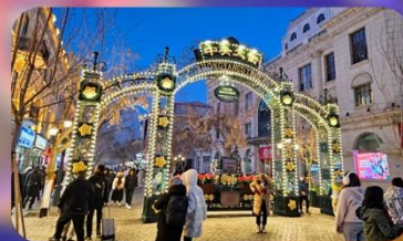
ถนนจงหยาง