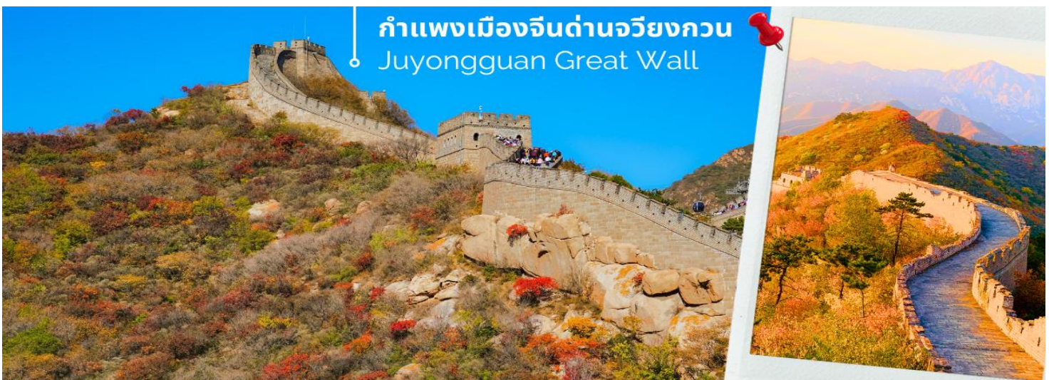
กำแพงเมืองจีนด่านจวิยงกวน Juyongguan Great Wall

จากนั้นนำท่านเดินทางชมความยิ่งใหญ่ของ กำแพงเมืองจีนด่านจวิยงกวน (Juyongguan Great Wall) หรือที่รู้จักกันในชื่อ ป้อมจวิยง เป็นด่านที่ใกล้กับใจกลางกรุงปักกิ่งมากที่สุด ราว 50 กิโลเมตร เท่านั้น นับเป็นหนึ่งในด่านสำคัญและเป็นสัญลักษณ์ของกำแพงเมืองจีน มีความยาวราว 4 กิโลเมตร ตั้งอยู่ทางทิศตะวันตกเฉียงเหนือของกรุงปักกิ่ง สร้างขึ้นในสมัย จีนซีฮองเต้ กำแพงนี้ตั้งอยู่ในหุบเขา Guangou ทำให้มีข้อได้เปรียบโดยธรรมชาติคือสามารถ "ยึดครองได้ง่าย แต่โจมตีได้ยาก" ถือว่าเป็นหนึ่งในจุดเริ่มต้นของกำแพงเมืองจีนในภาคเหนือ ซึ่งสร้างขึ้นเพื่อป้องกัน