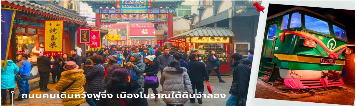
ถนนคนเดินหวังฝูจิ่ง เมืองโบราณใต้ดินจำลอง

จากนั้นนำท่านสู่ เมืองโบราณใต้ดินจำลอง เป็นหลุมหลบภัยทางอากาศ ในยุคของสงครามเย็นระหว่างจีนและอดีตสหภาพโซเวียต โดยใช้แรงงานคนหลายหมื่นคนมีทั้งชาวบ้าน และนักเรียน นักศึกษาในการขุด โดยไม่มีเครื่องจักรช่วยเลย ซึ่งแสดงเป็นภาพให้เห็นที่ผนังอุโมงค์ ปัจจุบัน จึงมีการจำลองเมืองใต้ดินให้ฟื้นคืนชีพอีกครั้งในบางส่วน เพื่อวัตถุประสงค์ด้านการท่องเที่ยว เมื่อปี 1980 ซึ่งดึงดูดนักท่องเที่ยวได้อย่างมาก โดยใช้พื้นที่ส่วนหนึ่งเปิดเป็นร้านขายงานฝีมือ เครื่องเขียนจีน เช่น พู่กัน แท่นหมึก เครื่องประดับหยก ไช่มุก ภาพลายมือของบุคคลมีชื่อเสียง ยาจีน และงานหัตถกรรมต่างๆ ทั้งยังให้บริการปรึกษาแพทย์แผนจีน อีกด้วย