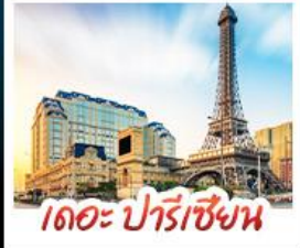
เดอะ ปารีสเซียน

สัมผัสบรรยากาศ เดอะ เวเนเซียน มาทากู เสมือนได้เยือนลาสเวกัส ชมความวิจิตรตระการตาของพระราชวังหยวนหมิงหยวนใหม่แห่งจิ้นใต้ เช็กอินกับแลนด์มาร์กสุดฮิตจตุรัสฮวาอิงถ่ายุรปูกับหอทีวีของกวางเจา เที่ยวชมหมู่บ้านสไตล์ยุโรปแห่งใหม่ของเซินจิ้น • ช้อปปิ้งเพลิน ๆ ที่ ห้างสรรพสินค้า COCO PARK ถนนคนเดินฟู้หัวหลี่และถนนคนเดินบิกกิ้ง