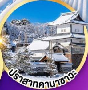
ปราสาทคานาซาวะ