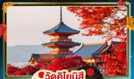
🍁 วัดคิโยมิสึ