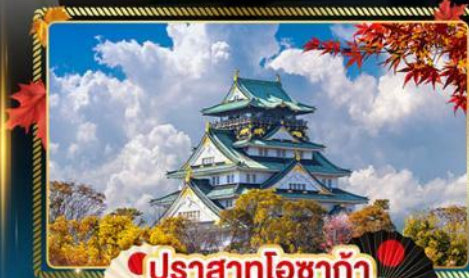
🍁 ปราสาทโอซาก้า

🧳 บ้านนักกระเป่า 20 Kg. บริการอาหารบนเครื่องไป-กลับ