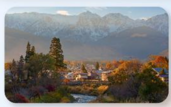
ไออิเดะ ปาร์ค