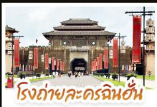
โรงถ่ายละครฉินอัน

ชมวิวนุ้บ้านม้งซีเจียงพันหลังคา • อุทยานเสี่ยวชิ่ง มนต์เสน่ห์จิวจิวโกวน้อย • อิสระช้อปปิ้งกับถนนคนเดิน สามตรอกสองซอย • สูดอากาศให้เต็มปอดบนยอดเขาชิงชิ่ง พร้อมชมความสวยงามของมวลดอกไม้ตามฤดูกาล