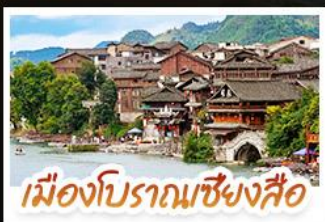
เมืองโบราณเซียงซือ