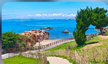
เกาะสี่เหลี่ยมเต่า