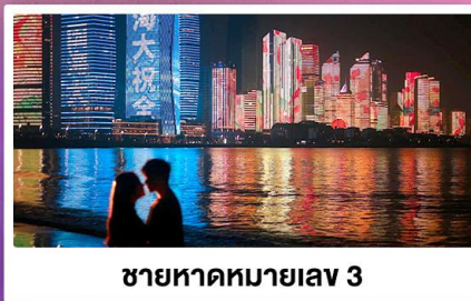
ชายหาดหมายเลข 3