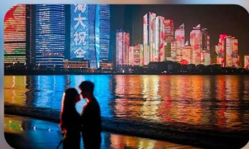
ชายหาดหมายเลข 3