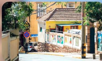
ถนนหลงเจียง