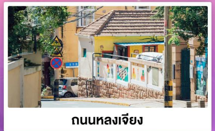
ถนนหลงเจียง