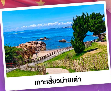
เกาะเสี่ยวมายเต่า

เที่ยวชิงเต่า เมืองทะเลสุดชิล ครบทั้งกิน เที่ยว ถ่ายรูป