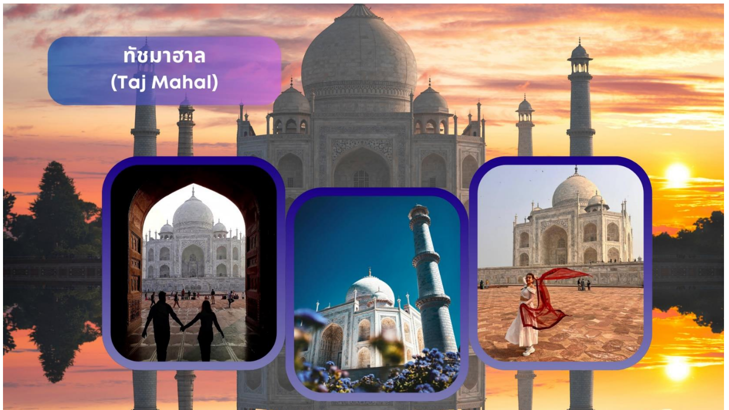
ทัชมาฮาล (Taj Mahal)

เข้าชมด้านใน ทัชมาฮาล (Taj Mahal) แหล่งมรดกโลกและเป็น 1 ใน 7 สิ่งมหัศจรรย์ที่สำคัญของโลก นำท่านเดินสู่ประตูสุสานที่สลักตัวหนังสือภาษาอาระบิกที่เป็นถ้อยคำอุทิศและอาลัยต่อบุคคลอันเป็นที่รักที่จากไปอนุสรณ์สถานแห่งความรักอันยิ่งใหญ่และอมตะของพระเจ้าชาห์จาฮันที่มีต่อพระนางมุมตซ์ โดยสร้างขึ้นในปี ค.ศ. 1631 และนำท่านถ่ายรูปกับลานน้ำพุที่มีอาคารทัชมาฮาลอยู่เบื้องหลัง แล้วนำท่านเข้าสู่ตัวอาคารที่สร้างจากหินอ่อนสีขาวบริสุทธิ์ที่ประดับลวดลายด้วยเทคนิคฝังหินสีต่างๆ ลงไปในเนื้อหิน สถาปัตยกรรมชิ้นเอกของโลกที่ออกแบบโดยช่างจากเปอร์เซีย โดยอาคารตรงกลางจะเป็นรูปโดมซึ่งมีหอคอยสี่เสาล้อมรอบ ตรงกลางด้านในเป็นที่ฝังพระศพของพระนางมุมตซ์ มาฮาล และ พระเจ้าชาห์จาฮัน ได้อยู่คู่เคียงกันตลอดชั่วชีวิต ทัชมาฮาลแห่งนี้ใช้เวลาก่อสร้างทั้งหมด 22 ปี โดยสิ้นเงินไป 41 ล้านรูปี มีการใช้ทองคำประดับตกแต่งส่วนต่างๆ ของอาคารหนัก 500 กิโลกรัม และใช้คนงานกว่า 20,000 คน ต่อมานำท่านเดินอ้อมไปด้านหลังที่ติดกับแม่น้ำยมุนาโดยฝั่งตรงกันข้ามจะมีพื้นที่ขนาดใหญ่ถูกปรับดินแล้ว โดยเล่ากันว่าพระเจ้าชาห์จาฮันเตรียมที่จะสร้างสุสานของตัวเองเป็นหินอ่อนสีดำโดยตัวรูปอาคารจะเป็นแบบเดียวกันกับทัชมาฮาล เพื่อที่จะอยู่เคียงข้างกัน แต่ถูกออร์ังเซป ยึดอำนาจและนำตัวไปคุมขังไว้ในป้อมอัคราเสียก่อน **เนื่องจากทัชมาฮาลปิดทุกวันศุกร์ กรณีที่เข้าทัชมาฮาลตรงกับวันศุกร์ ทางบริษัทขอสงวนสิทธิ์สลับโปรแกรมเที่ยวตามความเหมาะสม**