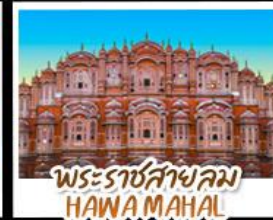
พระราชสาลม HAWA MAHAL