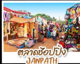
ตลาดช้อปปิ้ง JANPATH