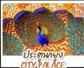
ประตูทอง CITY PALACE