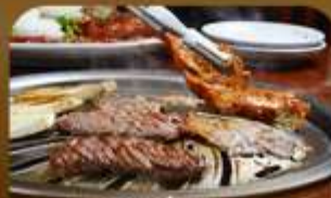
เมนูช่างสโวล์เกาหลี