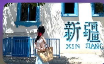
ถนนคนเดินหลิวซิงเจียง