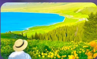
ทะเลสาบไซ่หลี่มู่