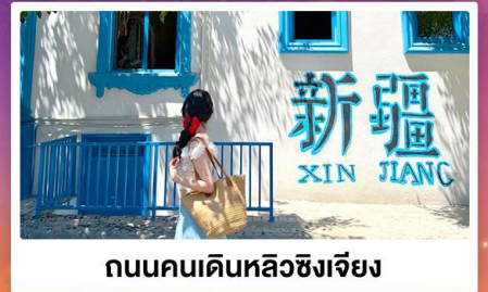
ถนนคนเดินหลิวซิงเจียง