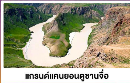
แกรนด์แคนยอนคูซานจื่อ