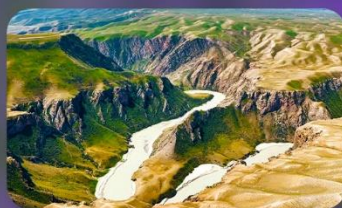
แกรนด์แคนยอนคูซานจื่อ