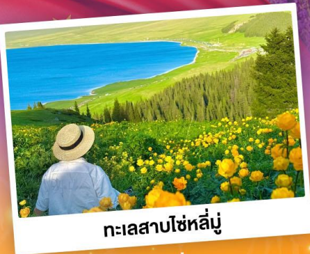
ทะเลสาบไซเหล็่มู่