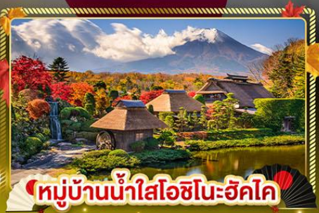
หมู่บ้านน้ำใสโอชิโนะฮัคโค