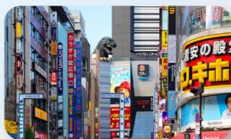
ซัปปังชินจูกุ