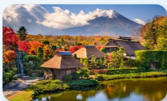
หมู่บ้านน้ำใสโอชิโนะฮัคโค

FUJI HOTEL AREA หรือเทียบเท่า NARITA HOTEL AREA หรือเทียบเท่า NARITA HOTEL AREA หรือเทียบเท่า