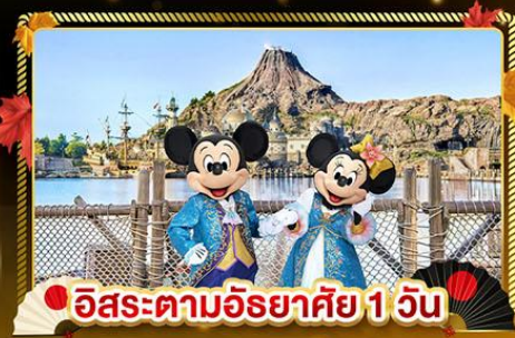
อิสระตามอริยาตสึ 1 วัน