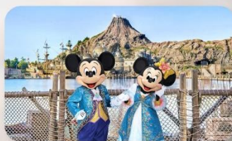
อีสะะตามอริยาศัย 1 วัน