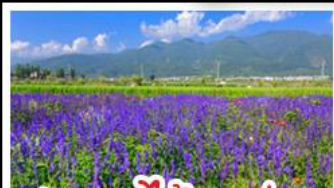
สวนดอกไม้ฮาวอวี่มู่ฉ่าง