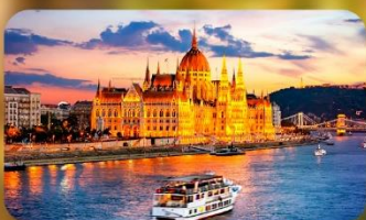
ล่องเรือแม่น้ำดานูบ ช่วง Twilight พร้อมจิบแชมเปญ