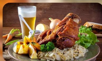
พิเศษ! ลิ้มลองเมนูประจำชาติ ทั้ง 5 ประเทศ!!!