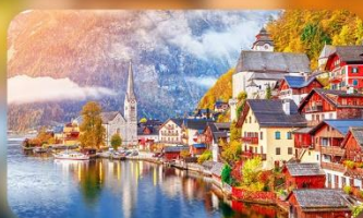
การันตีพัก Hallstatt / St. Wolfgang หรือริมทะเลสาบ 1 คืน