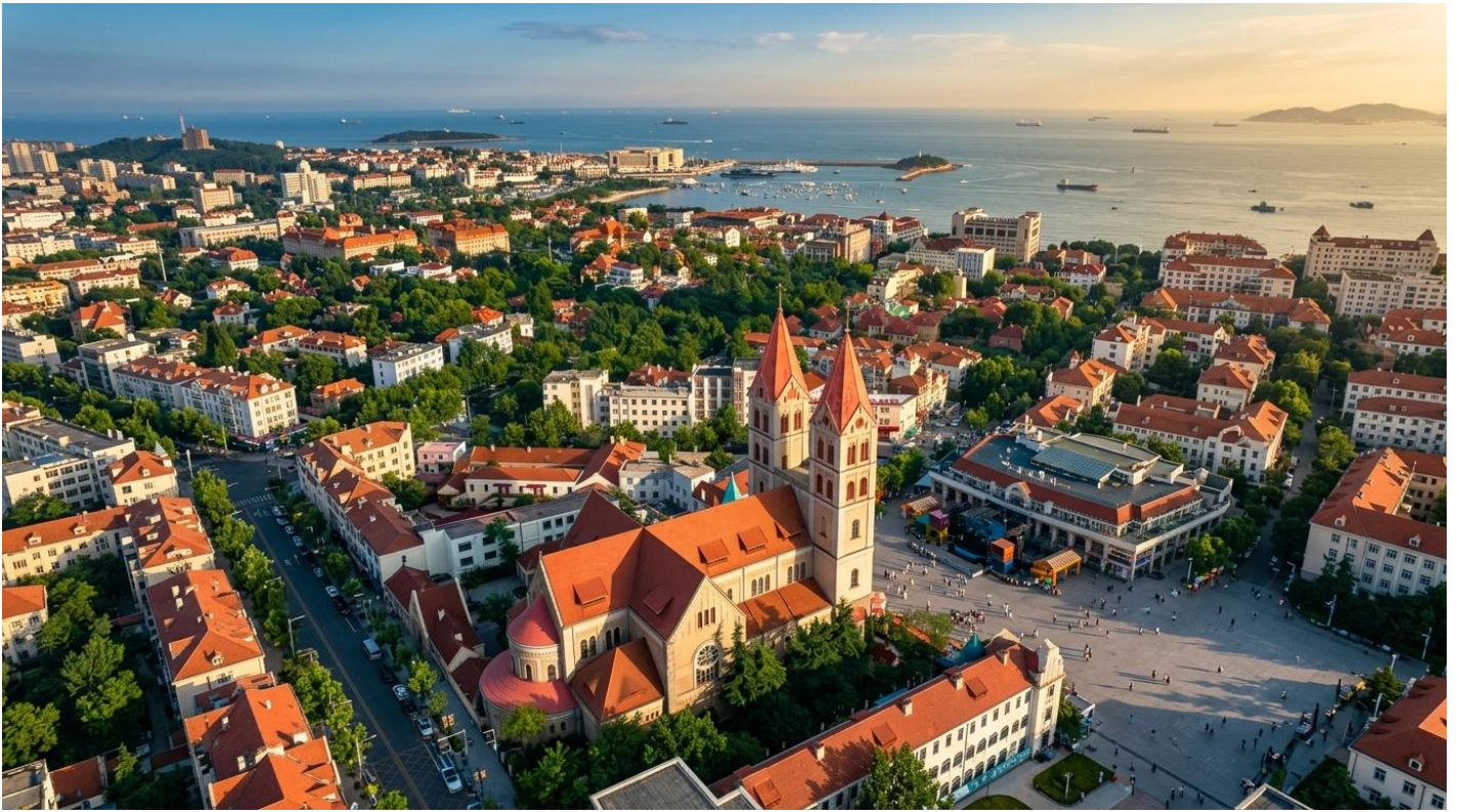
ป้าย นำท่านเดินทางกลับสู่ เมืองชิงเต่า (ระยะทาง 226 ก.ม. ใช้เวลาเดินทางประมาณ 3.5 ชั่วโมง)