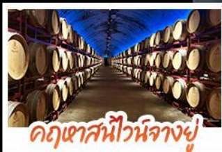
คฤหาสน์ไวน์นางยู