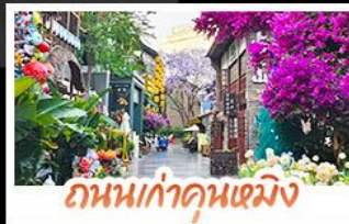
ถนนเก่าคุณเหมิง