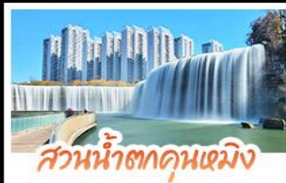
สวนน้ำตกคุณเหมิง