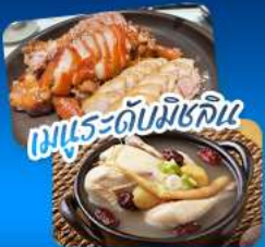
เมนูระดับมิชลิน

เที่ยวชม 3 เมืองฮิต โซล - แทกู - ปูซาน สัมผัสเสน่ห์เกาหลีหลากหลายสไตล์ • ชมพระราชนิเวศน์กyeongju ดึง Lotte World Tower พร้อมจุดชมวิว Seoul Sky ในกรุงโซล • ชิคอินถนน Art Street ตามรอย BTS ตลาดชอมนุน • แลนด์มาร์ก 83 Tower ที่แทกู • ปักถ่ายที่ปูซานกับวัดแดงยงกุงซา หมู่บ้านวัฒนธรรมคิมซอน ไฮไลท์นั่งรถไฟสายแคปซูลชมวิวกะเลสูดประทับใจ • เดินทางสะดวกด้วยรถไฟความเร็วสูง KTX อิ่มอร่อยกับเมนูพิเศษ จากเกาหลีและไต้หวันสไตล์ระดับมิชลิน เก็บครบทุกความประทับใจในทริปเดียว