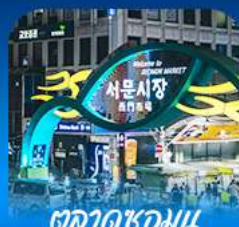
ตลาดชอมนุน