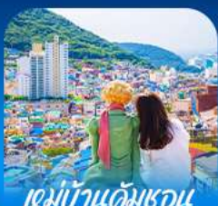
หมู่บ้านดัมเชอน