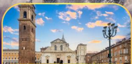
ถ่ายภาพกับมหาวิหารตูริน