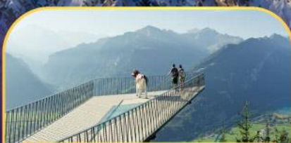
นั่งรถกระเช้าไฟฟ้า ฮาร์เดอร์ คูส์ม