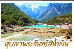
เขุบเขาพระจันทร์สีน้ำเงิน