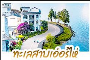
ทะเลสาบเอ๋อร์ไห่

นั่งรถม้าสุดฟิน ชมทุ่งข้าวสีทองเหลืองอร่าม • ทำรูป MOOD ที่ใช้กับวิวทะเลสาบเอ๋อร์ไห่สุดโรแมนติก ชมดอกไม้ตามฤดูกาลกลางขุนเขา ณ สวนฮวาบู๋ฉาง • พิชิตภูเขาหิมะมังกรหยกความสูงกว่า 4,506 เมตร (รวมกระเช้าใหญ่ ไป-กลับ) • นั่งรถไฟชมวิวภูเขาหิมะมังกรหยกวิวพาโนรามา • จิบกาแฟยามบ่าย พร้อมจุดเช็คอิน วิวหลักล้าน ณ ร้านกาแฟพวยงต๋อง (รวมค่าเครื่องดื่มท่านละ 1 แก้ว) • เที่ยวเมืองโบราณต้าหลี่ ลี่เจียง ไปซา ซีม ซ้อป เชนะ กับวัดบรมธรรมยุตยาน • ซ้อปบิงเฟลิม ณ ถนนคนเดินหนานผิงเจียและ POP MART