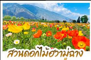
สวนดอกไม้ฮวามู่ฉาง