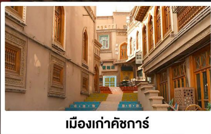
เมืองเก่าคัชการ