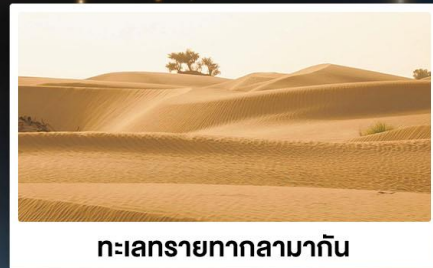
ทะเลทรายทากลามากัน