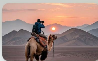
ทะเลทรายทากลามากัน