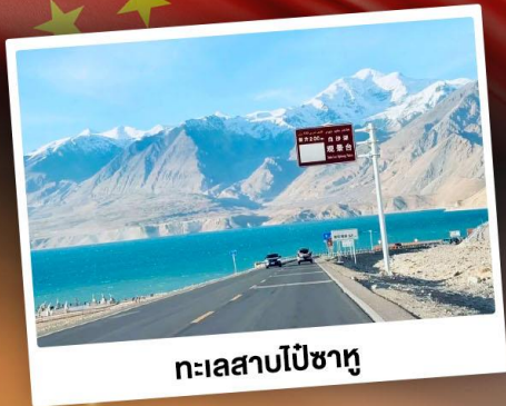
ทะเลสาบโป้ซาหู