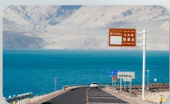
ทะเลสาบไป่ซาหู