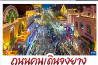
ถนนคนเดินจงยาง