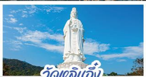
วัดเลิอัน