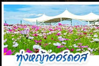
ทุ่งหญ้าเออร์โดส