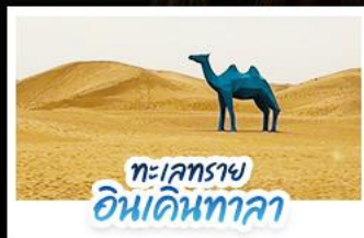
ทะเลทราย อินเคินทาลา