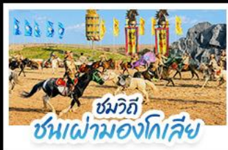
ชมวิถี ชนเผ่ามองโกเลีย

เปิดประสบการณ์ พักกระโจมมองโกลสุดพรีเมียมกลางทุ่งหญ้า สัมผัสบรรยากาศพระอาทิตย์ขึ้นสุดโรแมนติก ชมวิถีชนเผ่ามองโกเลีย พร้อมปาร์ตี้กองไฟใต้ท้องฟ้าเต็มไปด้วยดาว • ตะลุยทะเลทรายอินเคินทาลา ทำรูปสุดปังกลางทะเลทรายสีทอง • เที่ยวครบทั้งทุ่งหญ้าเออร์โดส วัฒนธรรมมองโกเลีย และเมืองสุดโมเดิร์นในกรีนปี้ดิว แบบสวยหรู ดูแพงทุกวัน