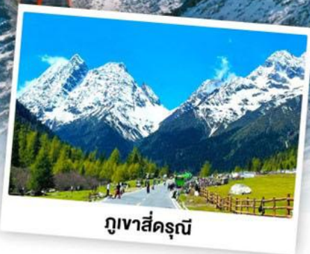
กุเวาสีครุณี

เดินทางโดย: สายการบินเจิงตูแอร์ไลน์ (EU)