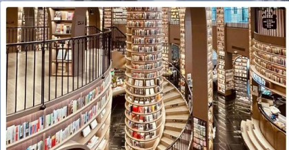
ร้านหนังสือจางชู่เก๋อ