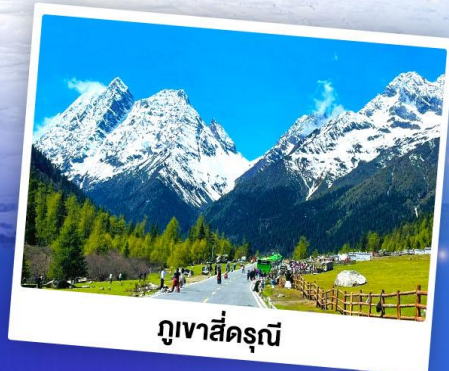
ภูเขาสี่ครุณี