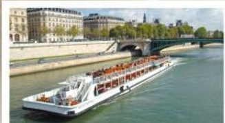
ส่องเรือแม่น้ำแซนน์