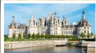
เข้าชมพระราชวังซ็องบอร์