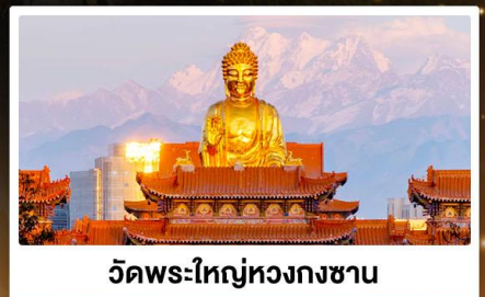
วัดพระใหญ่หวงกงชาน