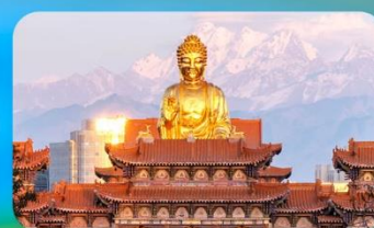
วัดพระใหญ่หวงกงชาน