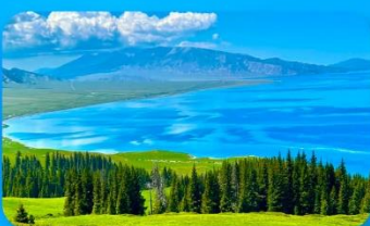
ทะเลสาบไซ่หลี่มู่