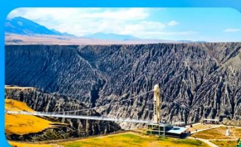
แกรนด์แคนยอนคูซานจื่อ