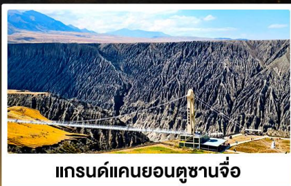
แกรนด์แคนยอนตู่ชานจื่อ