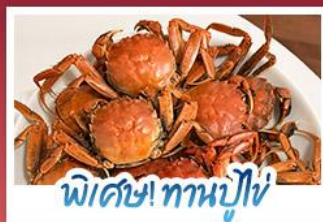
พิเศษ! ทานปูใหญ่

ปรากฏการณ์ธรรมชาติ 1 ปี มีแค่ครั้งเดียว! เตรียมชุดเก่งไปถ่ายรูปกับ 'หาดแดงผานจีน' ที่กำลังพรมสีแดงสดไปทั่วผืนน้ำ พร้อมฟินสุดขีดกับฤดูกาลทานปูที่คึกคักที่สุดแห่งปี • สัมผัสสวนนิลแห่งตะวันออกที่ตาหลายน