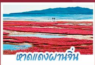
หาดแดงผานจีน