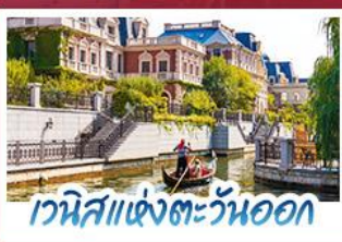
เวนิสแห่งตะวันออก